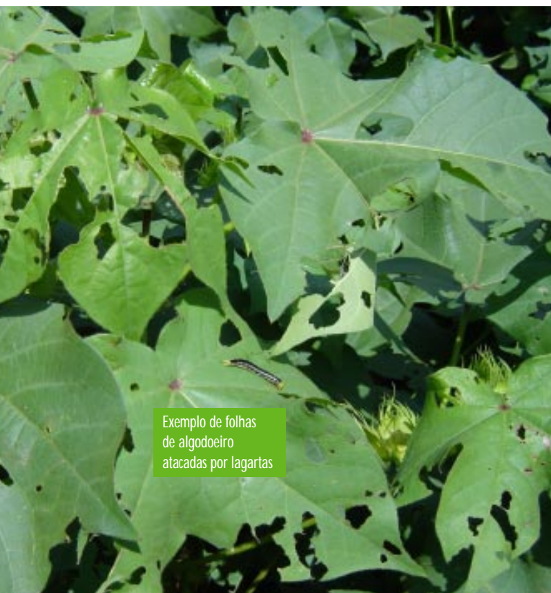
Exemplo de folhas de algodoeiro atacadas por lagartas