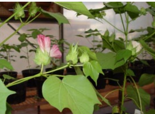
Exemplo de planta geneticamente modificada em laboratório

A possibilidade de contribuir com benefícios no médio prazo ao consumidor – e, de imediato, um aumento de competitividade ao agronegócio, principalmente ao serem consideradas as adequações de custos –, fez com que pesquisadores de empresas públicas e privadas do setor, universidades e centros de pesquisas investissem nesta tecnologia. Recursos financeiros e humanos foram direcionados para a Biotecnologia como ferramenta de apoio aos programas de melhoramento. Com isso, ganhou-se eficiência, pois o cientista pode introduzir uma característica de interesse sem modificar as demais existentes na planta receptora do novo gene.