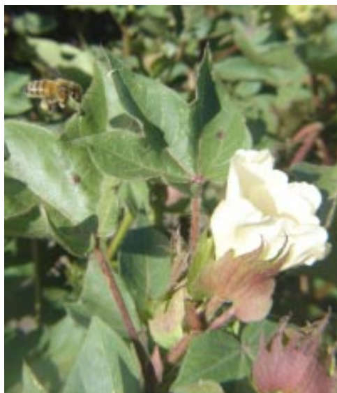
Polinização realizada por inseto