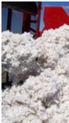
Campos de linhas de autofecundação ou de progênies e populações híbridas de algodoeiro