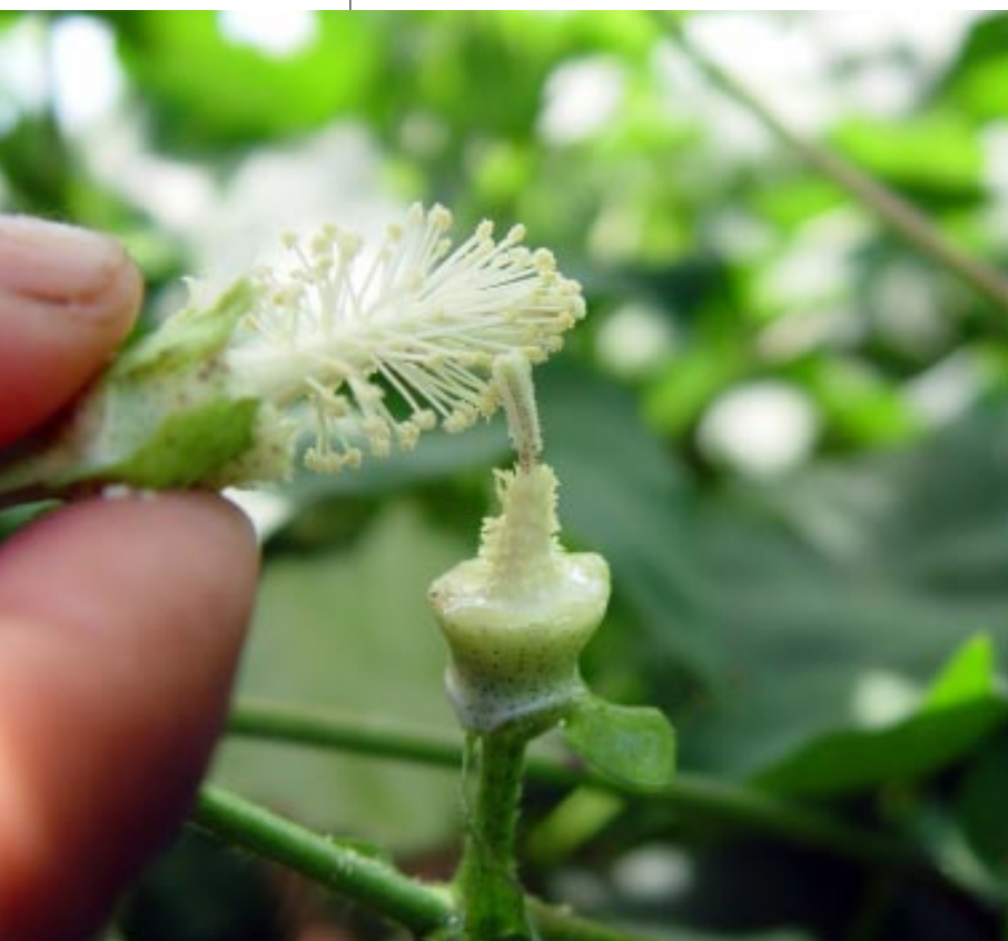
Exemplo de cruzamento artificial do algodoeiro

• Os EUA foram bem-sucedidos no projeto de erradicação do bicudo. Os produtores americanos estão conscientes de que os programas desenvolvidos com esse objetivo trouxeram grandes benefícios para a atividade e muito contribuíram para o sucesso da implantação do algodão transgênico nos Estados Unidos.