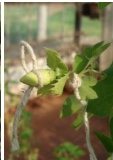
Autofecundação do algodoeiro em casa de vegetação