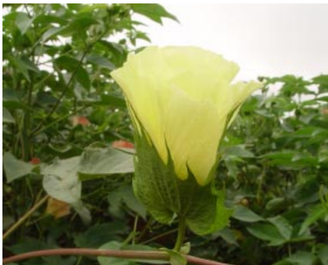
Flores de algodoeiro amarelas e com manchas vermelhas internas, características da espécie G. barbadense

O Brasil é considerado área de diversidade biológica das espécies G. barbadense , distribuídos pela Mata Atlântica e Amazônia. No País, foi encontrada a espécie selvagem G. mustelinum em Estados do Nordeste