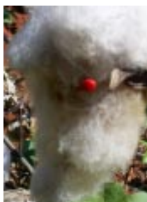
O algodão GM pode beneficiar agricultores e o meio ambiente pela redução do uso de agroquímicos, água e combustível